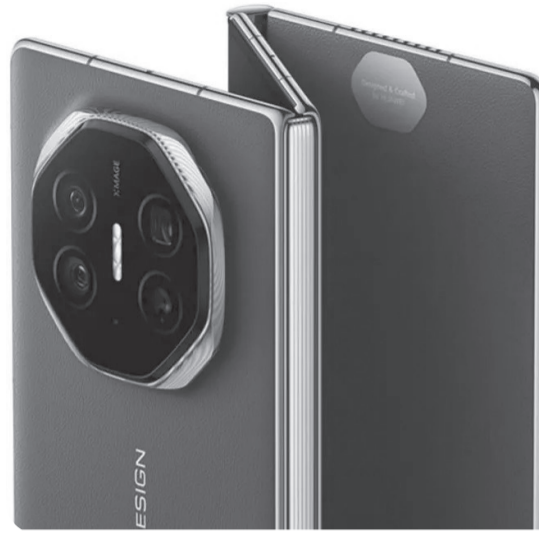
Huawei Mate XT Ultimate Design Reservations

أما "فايرفوكس"، فيتيح للمستخدمين أيضا تغيير محرك البحث الافتراضي، ولكن هذا يتطلب من مزود البحث إنشاء إضافة للمتصفح. ولا يبدو أن "أوبن إيه أي" قد أنشأت واحدة لـ "فايرفوكس" حتى الآن.