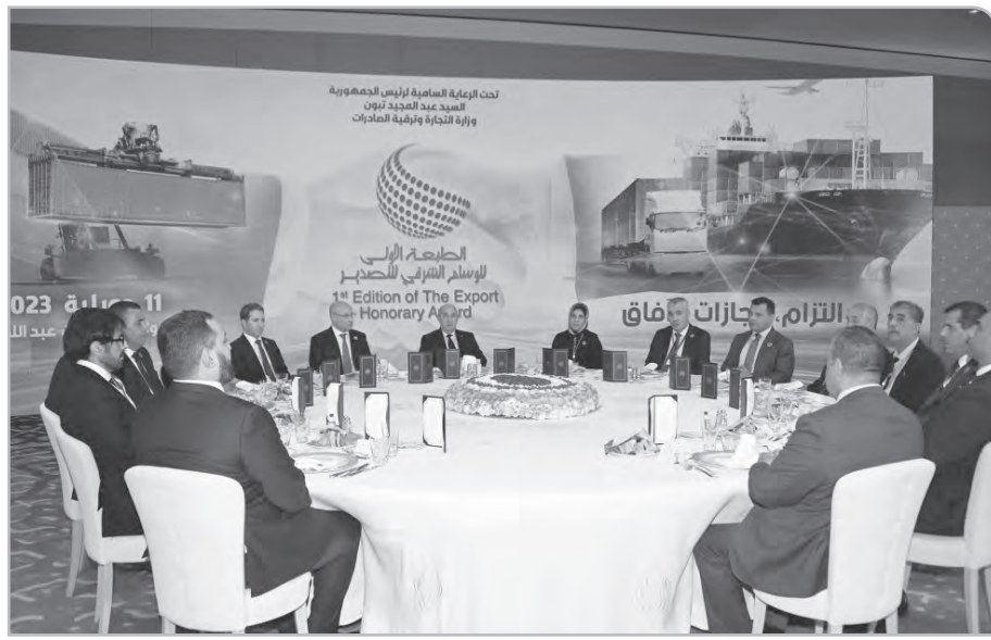
لمؤسسة "السويدي كابل ألبيريا" El Sewedy Cables Algeria

يذكر أنه وعلى هامش التظاهرة، زار رئيس الجمهورية معرضا خاصا بالمؤسسات المتوجة بالأوسمة و كذا الهيئات المرافقة لها في مجال التصدير، تم تنظيمه بالمناسبة، أين تلقى عروضاً عن نشاط المؤسسات المعنية و آفاق تطورها.