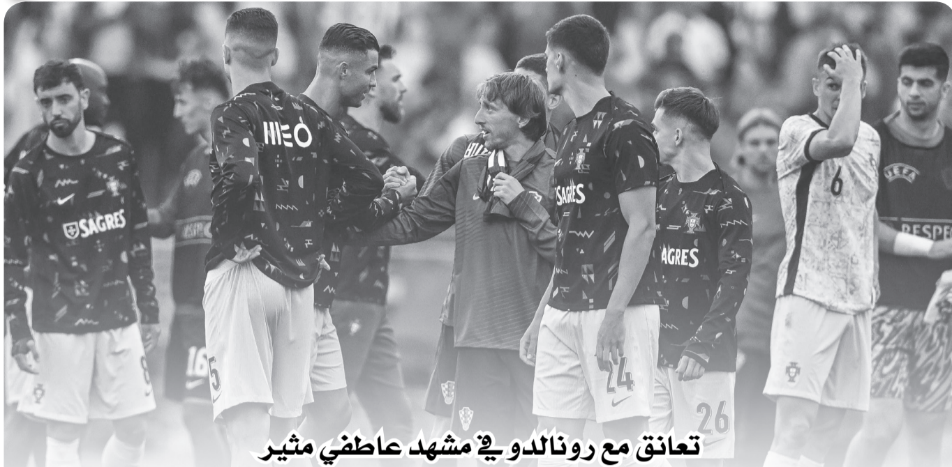
تعاقد مع رونالدو في مشهد عاطفي مثير