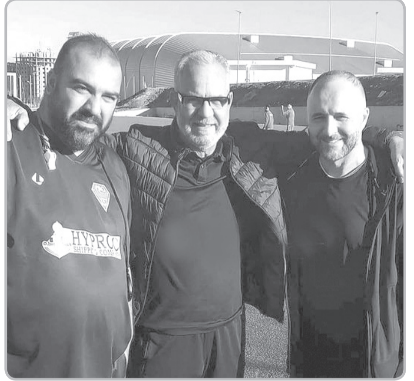
كشفت مصادر مقربة من الطاقم الفني للمنتخب الوطني أمس أن المدرب جمال بلماضي طالب من المسؤولين على الاتحادية الجزائرية لكرة القدم ببرمجة مباراة ودية يوم 31 ديسمبر

أوغندا تفوز خارج قواعدها امام الصومال في المجموعة السابعة