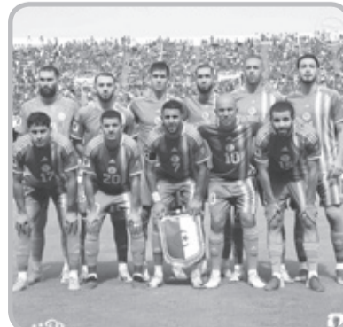
أعلنت الكونفدرالية الإفريقية لكرة القدم عن موعد تقديم القائمة الموسعة المكونة من 55 لاعب المرشحين للمشاركة في كأس أمم إفريقيا