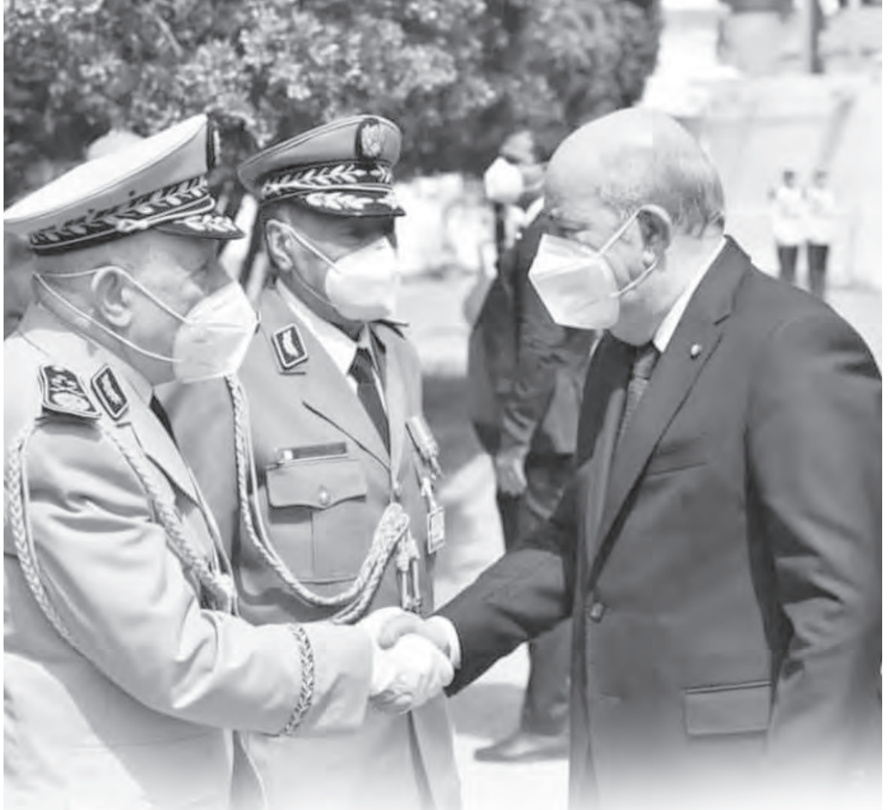
حملت اسم المجاهد الراحل عبد الحفيظ بوصوف