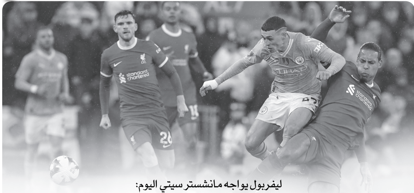
ليفربول يواجه مانشستر سيتي اليوم: