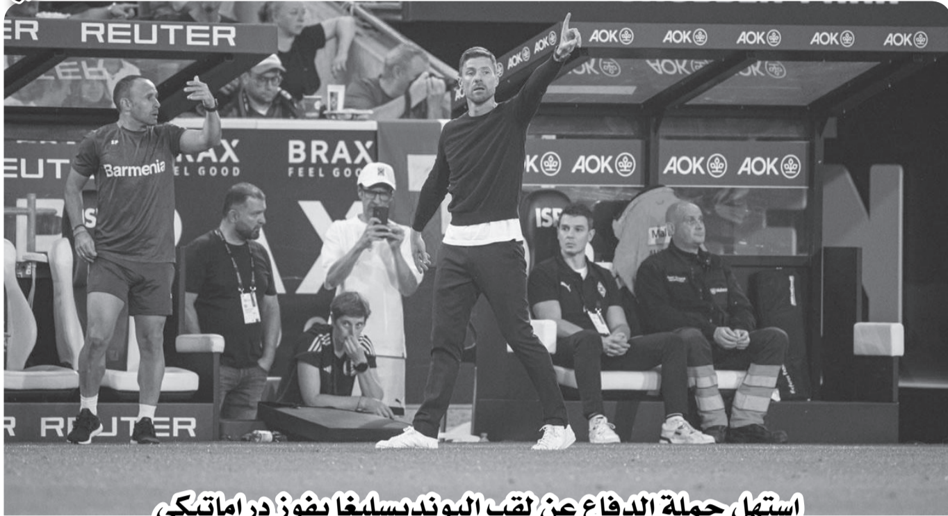
استهل حملة الدفاع عن لقب البوندسليغا بفوز دراماتيكي