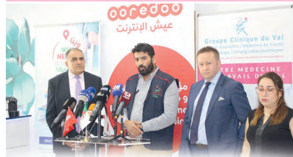
بالشراكة مع العيادة المتخصصة "أوبتي سواندوفال" وجمعية "وين نلقى"

إيمان. س وأوضح نفس المصدر أنه "في سياق الجهود المتواصلة المبذولة في مكافحة الإرهاب ومحاربة الجريمة المنظمة بكل أشكالها، نفذت وحدات ومفاز للجيش الوطني الشعبي، خلال الفترة الممتدة من 22 إلى 28 جوان 2022، عدد العمليات التي أسفرت عن نتائج نوعية تعكس مدى الاحترافية العالية واليقظة والاستعداد الدائم لقواتنا المسلحة في كامل التراب الوطني". وفي إطار مكافحة الإرهاب، أوقفت مفاز للجيش الوطني الشعبي "ثلاثة عناصر دعم للجماعات الإرهابية في عمليتين منفصلتين عبر التراب الوطني". وفي إطار "عمليات محاربة الجريمة المنظمة ومواصلة للجهود الحثيثة الهادفة إلى التصدي لآفة الاتجار