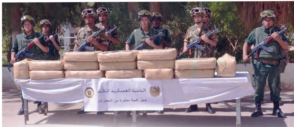
الجيش يضبط 11 قنطارا من الكيف المعالج ويوقف تجار مخدرات