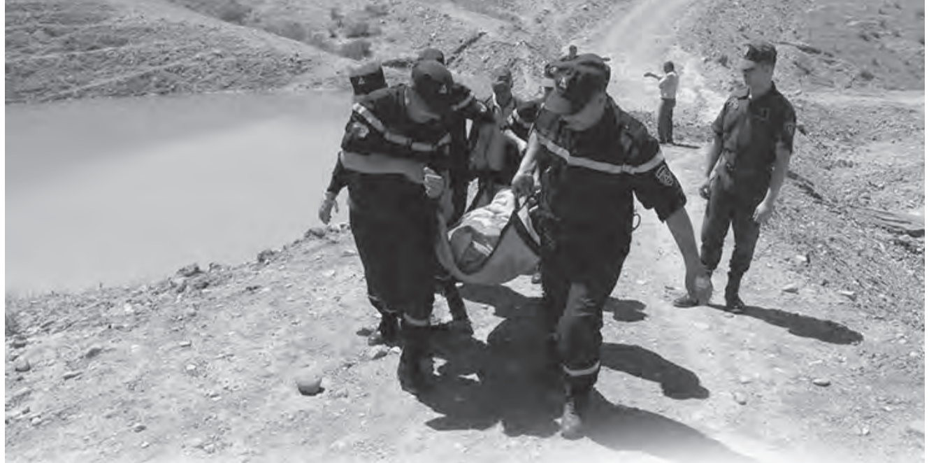
تسجيل عشرات الضحايا من الأطفال والمراهقين في ظرف أسبوع

للتذكير فقد استفاد المشروع مؤخرا من مبلغ 14 مليار دج لإتمام أشغال انجاز الطريق المزدوج واستكمال الأشغال بصفة نهائية مما ساهم بشكل كبير في دفع وتيرتها لتسليمه في أجاله المحددة، كما أشير إليه. وقد بلغت نسبة تقدم أشغال هذا المشروع الذي يتكفل بتجسيده مجمع جزائري تركي (ماكبول) بتكلفة إجمالية قدرت بـ 40 مليار دج أزيد من 92 بالمائة.