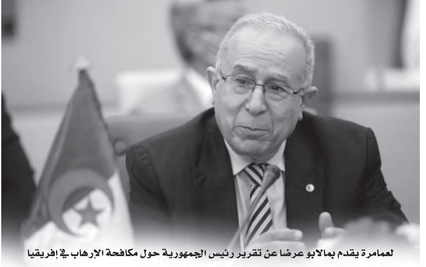
لعمامرة يقدم بمالابو عرضا عن تقرير رئيس الجمهورية حول مكافحة الإرهاب في إفريقيا