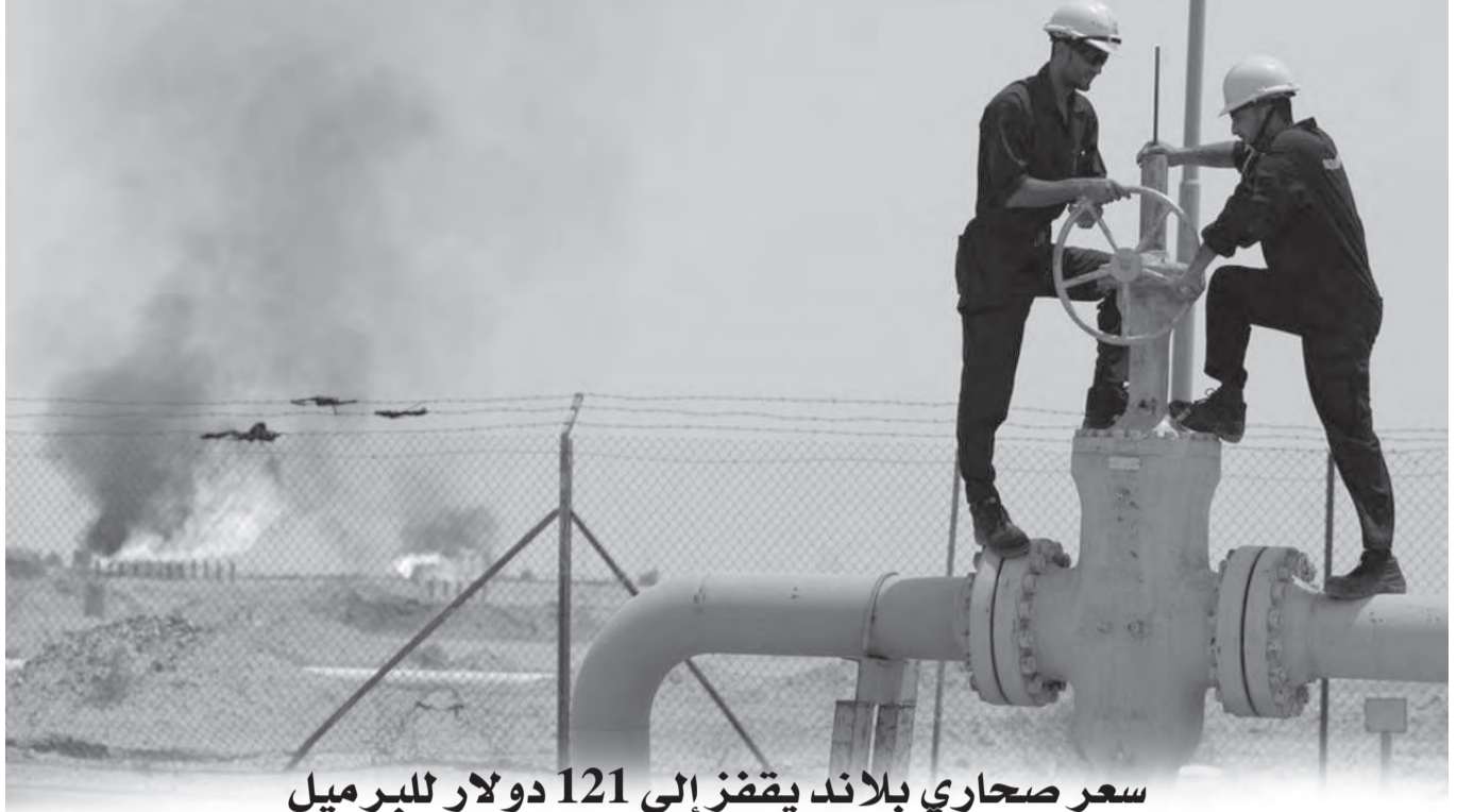
سعر صحاري بلاند يقفز إلى 121 دولار للبرميل

يذكر أن وزارة التجارة وترقية الصادرات كانت قد ألزمت المتعاملين الاقتصاديين الناشطين في مجال استيراد المواد الأولية والمنتجات والبضائع الموجهة لإعادة البيع على الحالة، على تقديم طلبات، على مستوى وكالة "الجيكس"، للتحقق من عدم توفر المواد والمنتجات التي يرمم استيرادها في السوق الوطنية. ويتم إدراج الوثيقة التي تسلمها مصالح "الجيكس" في ملف طلب التوطين البنكي لاستكمال إجراءات الاستيراد.