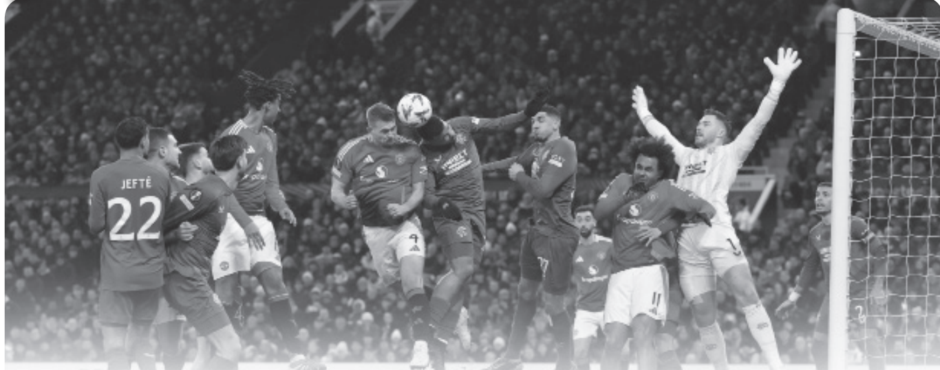
روما وبورتو في خطر يوروبا ليغ