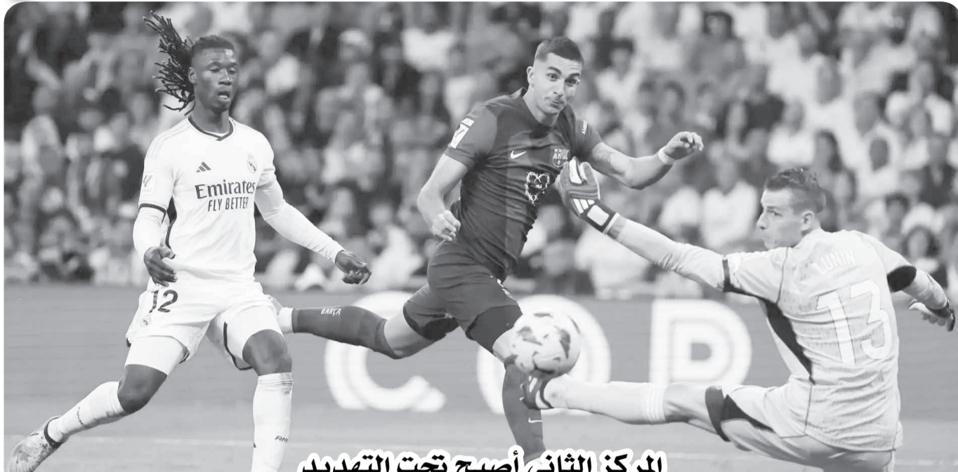
المركز الثاني أصبح تحت التهديد