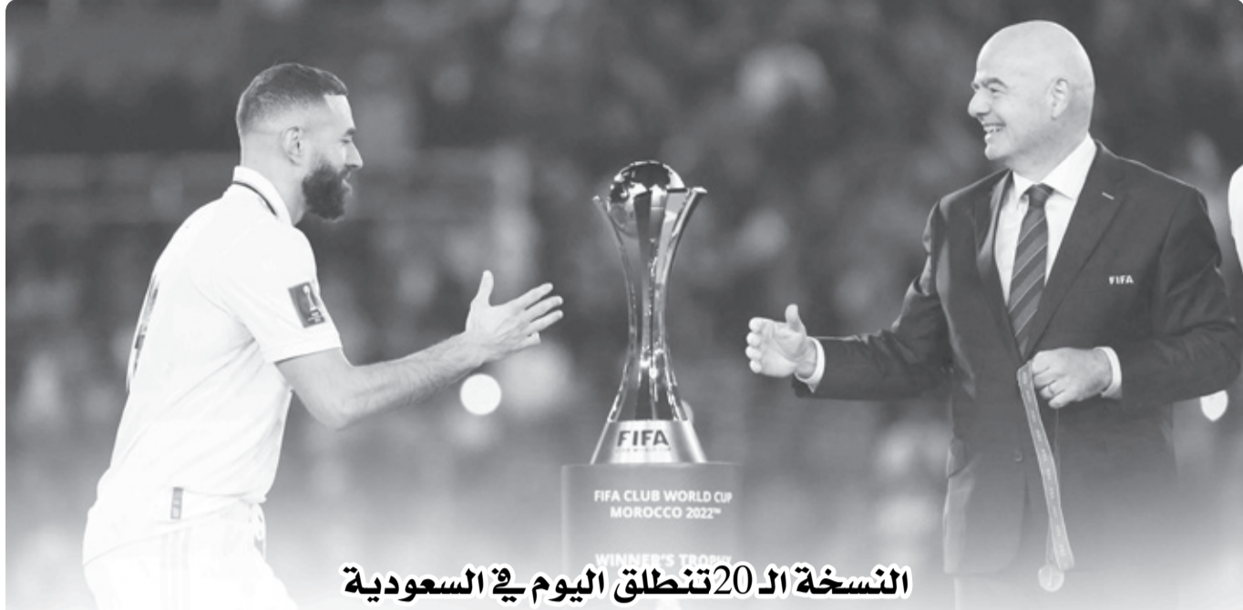
النسخة الـ 20 تنطلق اليوم في السعودية