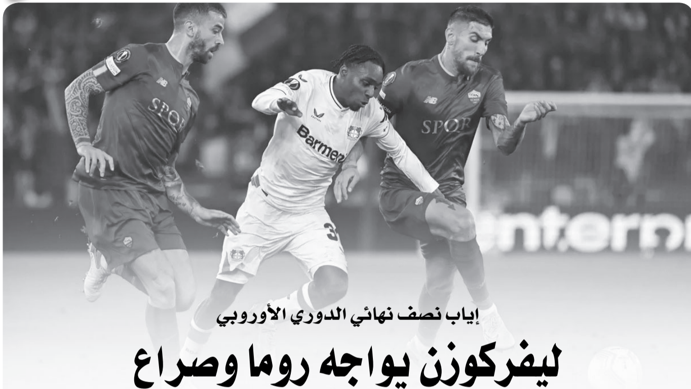
إياب نصف نهائي الدوري الأوروبي