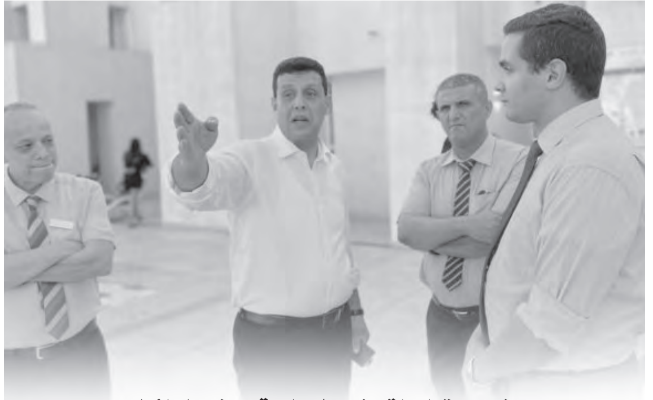
ضربت تعليمات وزير السياحة عرض الحائط

ع.ط خصص لتقييم الوضع العام في البلاد الرئيس تبون يترأس اجتماعا للمجلس الأعلى للأمن ترأس رئيس الجمهورية، القائد الأعلى للقوات المسلحة، وزير الدفاع الوطني، عبد المجيد تبون، أمس، بالجزائر العاصمة، اجتماعا للمجلس الأعلى للأمن، وفقا لما أورده بيان لرئاسة الجمهورية. وجاء في البيان: "ترأس، عبد المجيد تبون، رئيس الجمهورية، القائد الأعلى للقوات المسلحة، وزير الدفاع الوطني، اجتماعا للمجلس الأعلى للأمن، خصص لتقييم الوضع العام في البلاد".