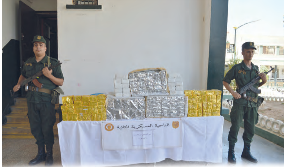
توقيف عنصري دعم للجماعات الإرهابية وإحباط محاولات إدخال المخدرات