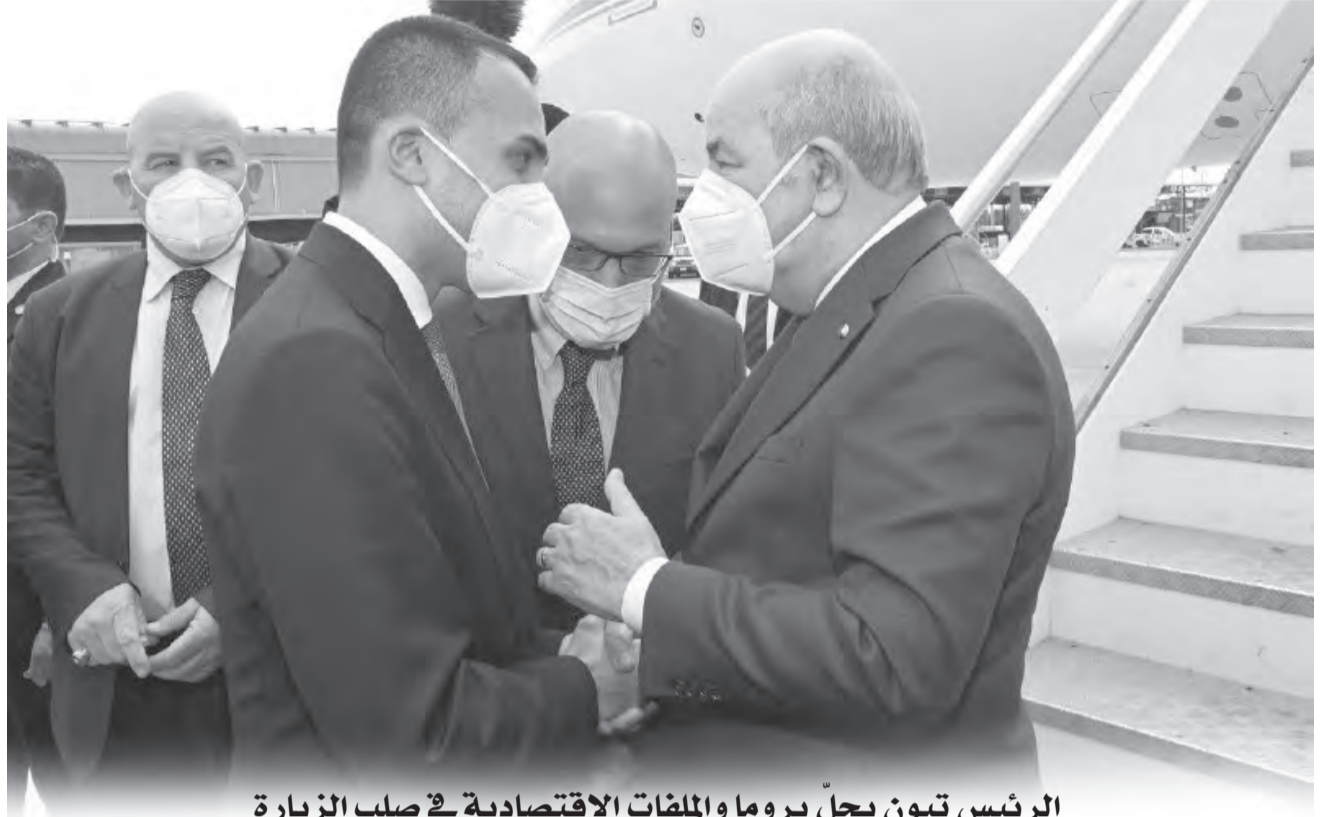
الرئيس تبون يحلّ يروما والملفات الاقتصادية في صلب الزيارة

وأبرز أن "قضية القدس الشريف التي تزعم الاحتلال الصهيوني، تواجه هجمات متعددة، آخرها هو الإذن الممنوح للمستوطنين اليهود لأداء طقوسهم في ساحة المسجد الأقصى، مما أدى إلى إدانة السلطات الفلسطينية لهذا الانتهاك الخطير للوضع التاريخي للحرم الشريف، دون أن نسمع أي ردة فعل للجنة القدس التي يرأسها ملك المغرب".