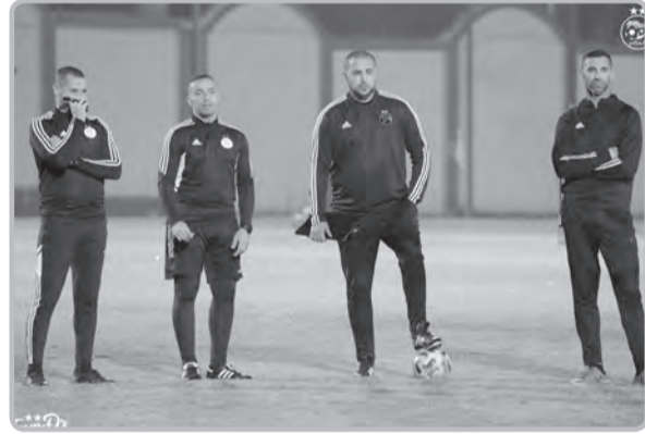
رديف "الخضر"، كونه لم يجر حتى هذه اللحظة تجديد تاريخ البطولة المقبلة "للشان"، وكذلك بطولة كأس العرب، رغم أن بعض سيدت في المستقبل".