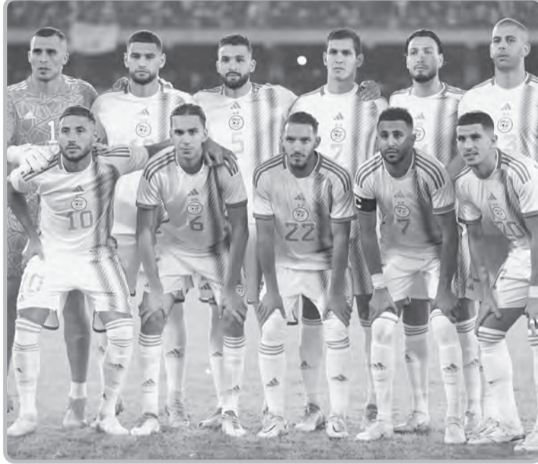
وسيتأهل الأولان عن كل مجموعة لنهائيات كأس أمم إفريقيا بكونت ديفوار-2023.

وعقب خوض جولتين من حملة التصفيات المؤهلة للعرس القاري بكونت ديفوار، يحتل أشبال النافخ الوطني جمال بلماضي صدارة ترتيب المجموعة السادسة برصيد 6 نقاط، متقدمة على النيجر صاحبة المركز الثاني بنقطتين، ثم أوغندا وتزانيا بنقطة واحدة،