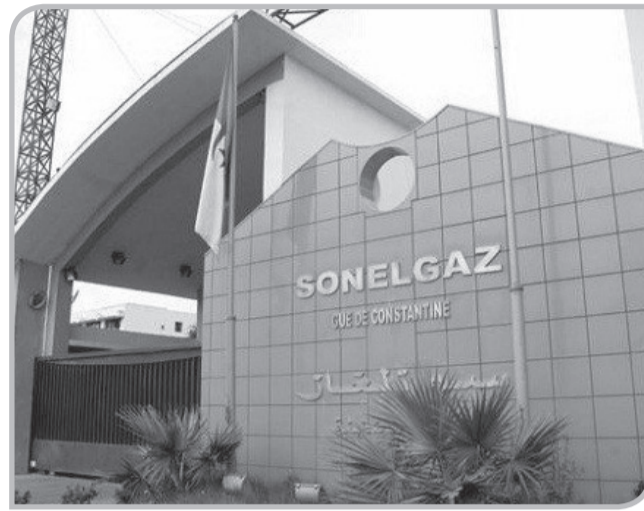
بلديات الحراش، الكالبتوس، الروبية، وأوضحت مديرية توزيع الكهرباء والغاز بالحراش، بأن عملية ربط

تواصل جهود فرق وأعاون مديرية توزيع الكهرباء والغاز بالحراش لربط السكنات بشبكتي الكهرباء والغاز، إذا سمحت عملياتها، منذ بداية السنة الجارية بربط 1498 مسكن بالكهرباء و1566 بالغاز الطبيعي.