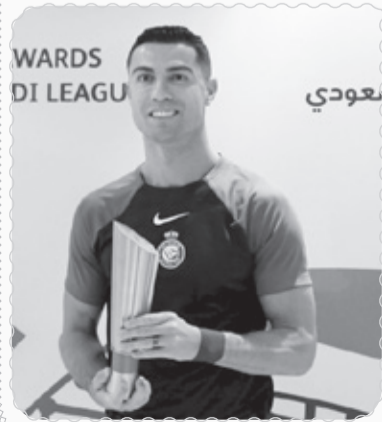
WARDS DI LEAGU بعودي

بالدور ربع النهائي. وكتبت القرعة، مواجهة كبرى، تنتظر نادي الوداد المغربي مع إنبيما النيجيري، في لقاء لن يكون سهلاً ذهبياً وإياباً بالنسبة إلى الوداد، في الوقت نفسه يواجه نادي الترجي التونسي، نظيره مازيمبي الكونغولي في لقاء ناري بين فريقين كبيرين يتنافسان على اللقب. وجاءت المواجهة الأخيرة لقرعة الدور ربع النهائي، لتجمع بين صن داونز الجنوب أفريقي