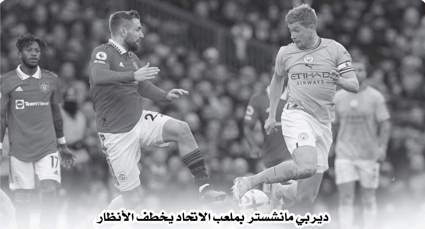
ديربي مانشستر بملعب الاتحاد يخطف الأنظار