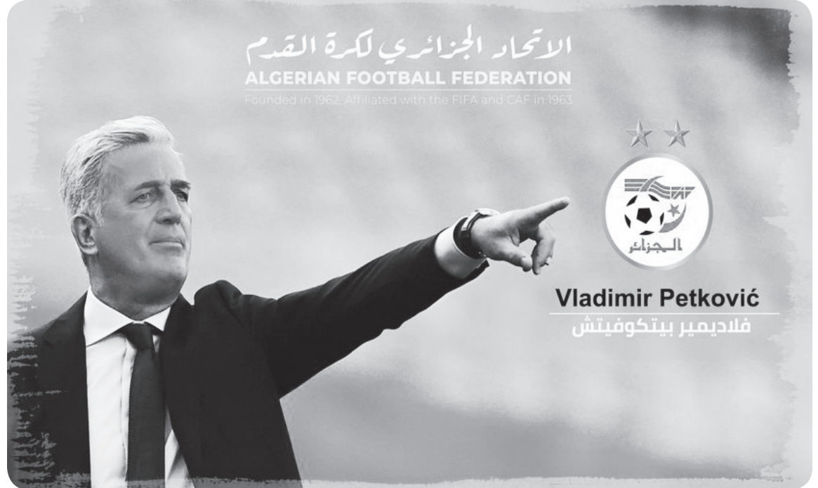
Vladimir Petković فلاميمير بيتكوفيتش