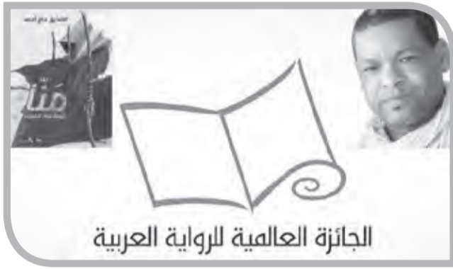
الجائزة العالمية للرواية العربية

وتشتمل القائمة الطويلة للجائزة المعلن عنها أمس على كتّاب من تسع دول عربية، تتراوح أعمارهم بين 40 و77 عاما، وتعالج رواياتهم قضايا متنوعة، من الهجرة وتجربة المنفى واللجوء، إلى العلاقات الإنسانية، سواء منها العابر أو العميق. كما تستكشف الروايات عالم الطفولة وتجارب التحول من الطفولة إلى النضج، مُظهرة من خلال ذلك الاضطرابات السياسية المتشعبة وشتى الصراعات الفردية والجماعية. في الروايات نجد السخرية والواقعية السحرية والديستوبيا والرمزية، كما