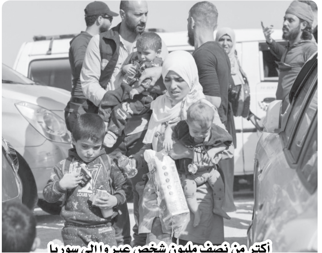
أكثر من نصف مليون شخص عبروا إلى سوريا