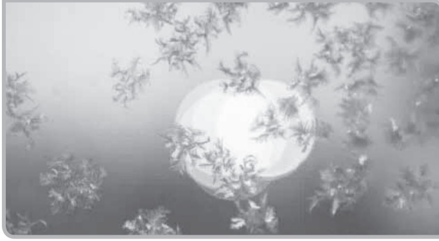
أشعة القمر فقد أعاد الخالق تسميتها بالنور. مصادر الضوء تنقسم مصادر الضوء علميا عادة إلى نوعين: مصادر مباشرة كالشمس والنجوم والمصباح والشعلة وغيرها، ومصادر غير مباشرة كالقمر والكواكب.

قال تعالى: { هو الذي جعل الشمس ضياء والقمر نورا } يونس: 5، فرق العليم الخبير في الآية الكريمة بين أشعة الشمس والقمر فسمى الأولى ضياء والثانية نورا. وإذا نحن بحثنا في قاموس عصري ما وجدنا جوابا شافيا للفرق بين الضوء الذي هو أصل الضياء والنور، ولوجدنا أن تعريف الضوء هو النور الذي تترك به حاسة البصر المواد. الفرق بين النور والضوء إذا بحثنا عن معنى النور وجدنا أن النور أصله من نار ينور نورا أي أضاء. فالكثير القواميس لا تفرق بين الضوء والنور بل تعتبرهما مرادفين لمعنى واحد. ولكن الخالق سبحانه وتعالى فرق بينهما فهل يوجد سبب علمي لذلك؟ دعنا نستعرض بعض الآيات الأخرى التي تذكر أشعة الشمس والقمر، فمثلا: في الآيتين التاليتين (وَجَعَلَ الْقَمَرَ فِيهِنَّ نُورًا وَجَعَلَ الشَّمْسُ سِرَاجًا) (وبيننا فوقكم سُبُحًا شِدَادًا * وَجَعَلْنَا سِرَاجًا وَهَاجًا) نجد أن الله سبحانه وتعالى شبه الشمس مرة بالسراج وأخرى بالسراج الوهاج والسراج هو المصباح الذي يضيء إما بالزيت أو بالكهرباء، أما