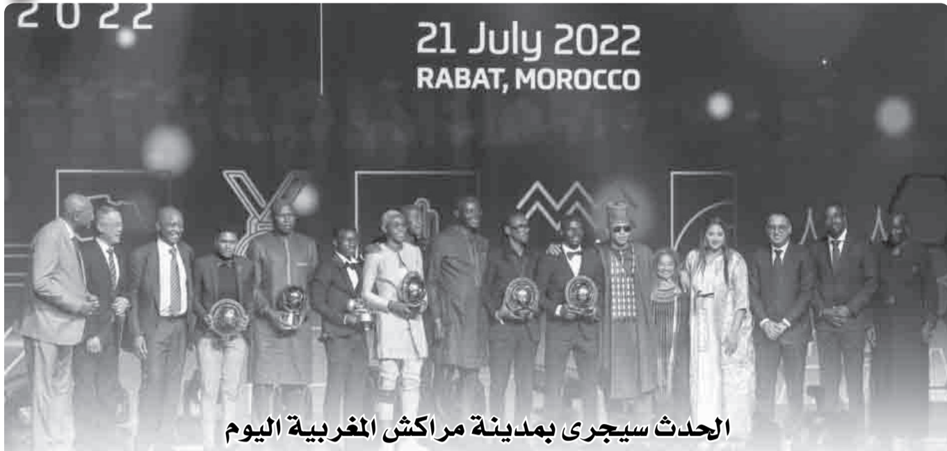
الحدث سيجرى بمدينة مراكش المغربية اليوم