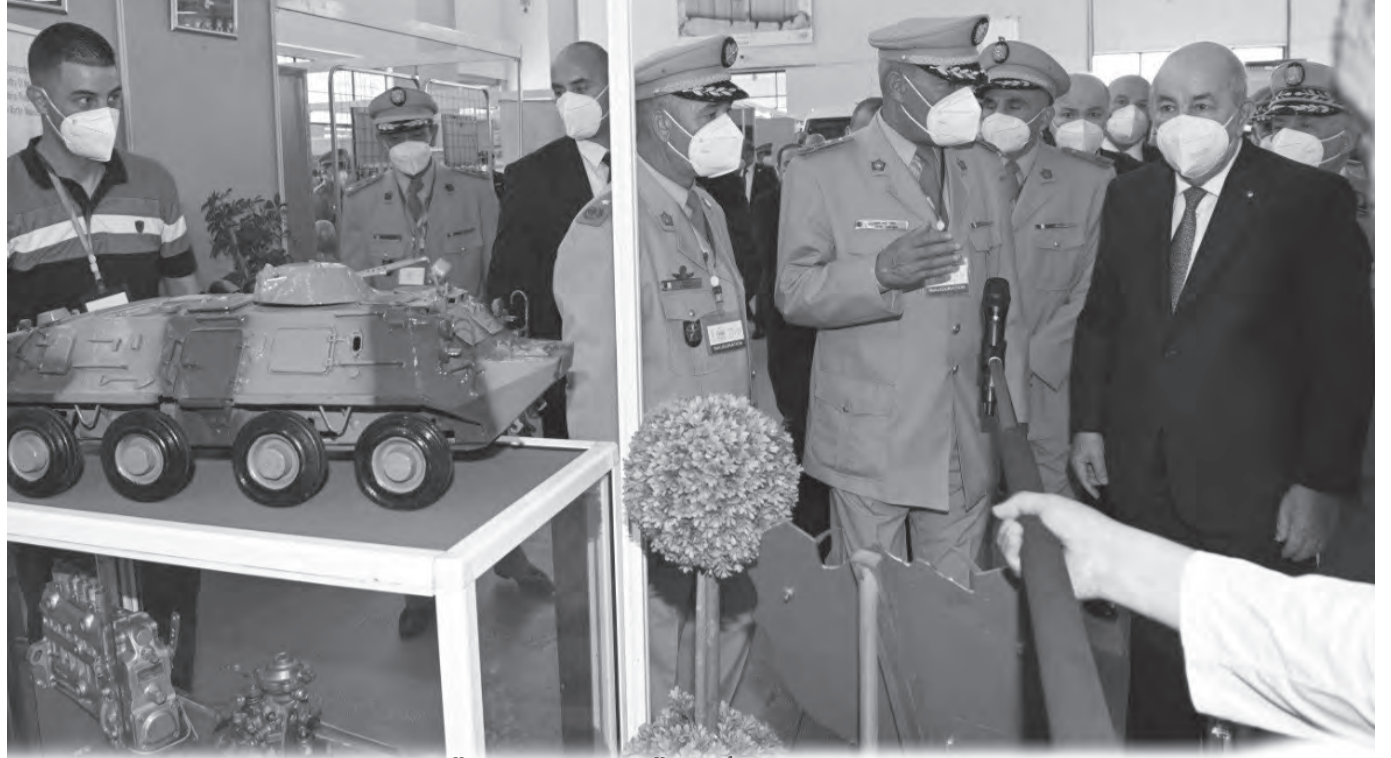
الرئيس تبون يصف الأمر بـ"المستعجل جداً"، ويعلن: