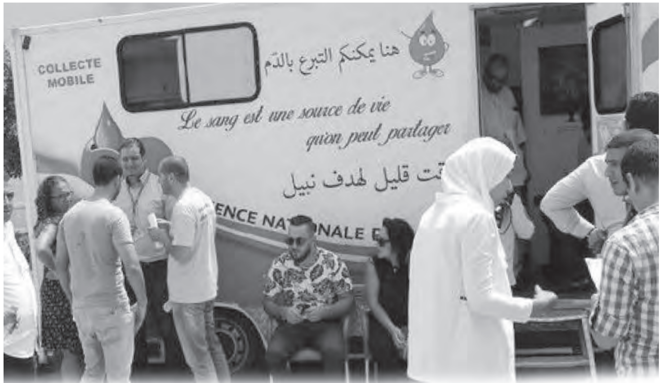
حملات تحسيسية، تظاهرات إعلامية ومبادرات عديدة بمناسبة اليوم العالمي للتبرع بالدم