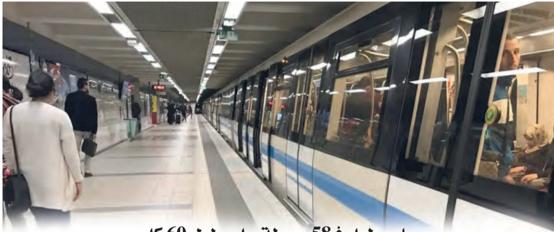
مساعي لبلوغ 58 محطة على طول 60 كلم