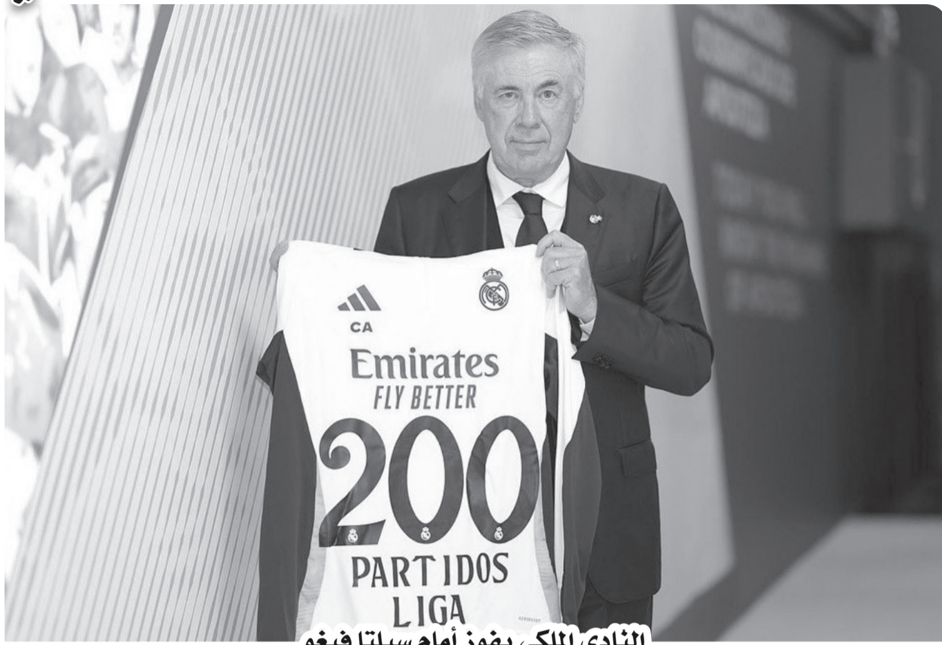
النادي الملكي يفوز أمام سيلتا فيغو