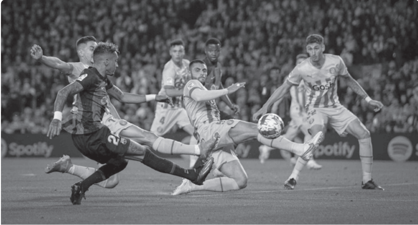
الجملة الـ16 من الدوري الإسباني