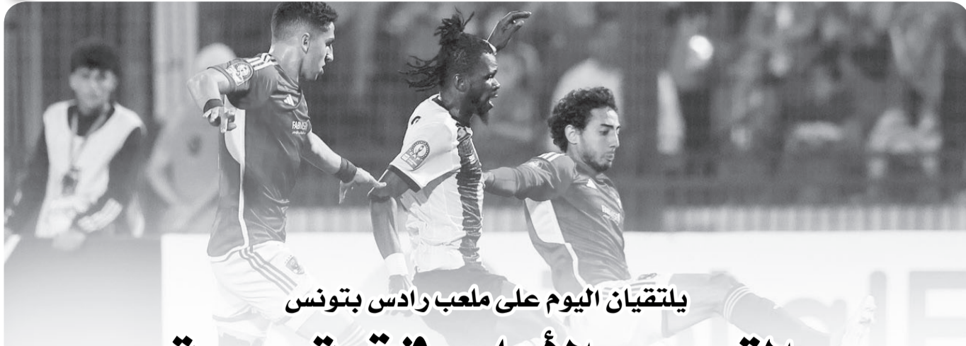
يلتقيان اليوم على ملعب رادس بتونس