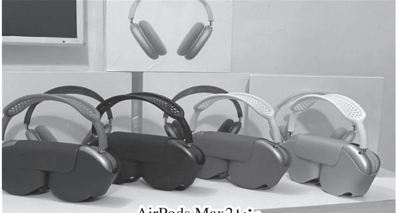
منها AirPods Max 2

وتقدم شركة "سناب"، المنافسة الأصغر حجماً، منصة "الينس استوديو" المجانية لصنع المحتوى بالواقع المعزز والتي تنتج للمطورين إنشاء مؤثرات تناسب الأسلوب الشخصي بالواقع المعزز.