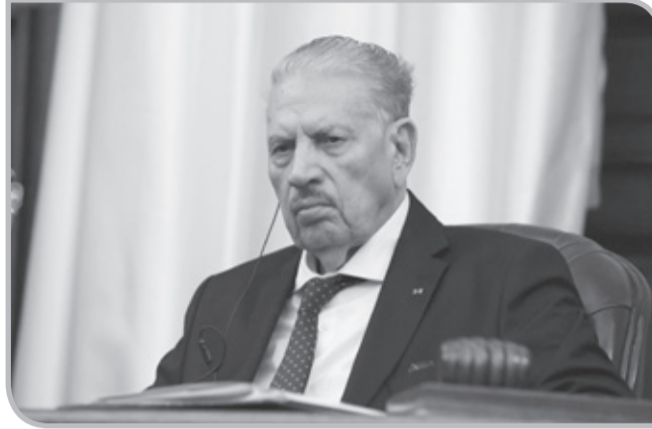
"موقف الجزائر شعبا وحكومة الداعم وعقب الوقوف دقيقة صمت ترحما للشعب الفلسطيني". على أرواح شهداء فلسطين، قال

قوجيل: "سنقف معهم في محنتهم، وكل العالم يعرف موقف الشعب الجزائري وحكومته مما يحدث في فلسطين"، مبرزا الرسالة القوية التي تحملها المسيرات المقررة غدا عبر كامل التراب الوطني لدعم الشعب الفلسطيني.