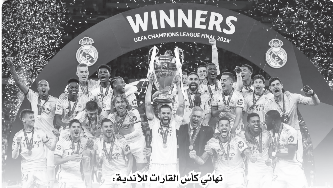
نهائي كأس القارات للأندية؛