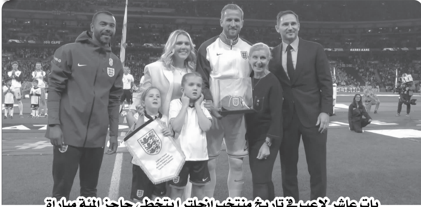
بات عاشر لاعبي في تاريخ منتخب إنجلترا يتخطى حاجز المئة مباراة