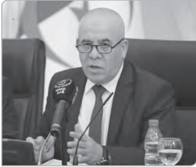
وتتجر شركة النقل بالسكك الحديدية دراسة جدوى لإنجاز مواقف عبر عدة احياء ستنتهي في جوان المقبل، ليتم استغلالها جزئيا خلال الثلاثي الأخير من 2023.

وأوضح شرفة في جلسة علنية بمجلس الأمة خصصت للأسئلة الشفوية، الخميس المنصرم أن "القطاع يعمل على دعم الخطوط الجوية الجزائرية، تنفيذًا لقرار رئيس الجمهورية، القاضي بدعم الأسطول بـ 25 طائرة جديدة، عبر اقتناء 15 طائرة وكراء 10 طائرات إضافية.» وسيسمح ذلك بتعزيز حضور الجوية الجزائرية واستغلال كافة المطارات الـ 36 المتواجدة عبر ولايات البلاد، حسب الوزير.