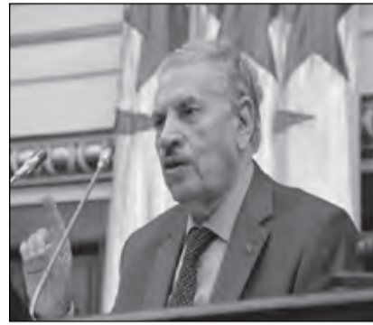
بالغ بما تتطلبه المرحلة وما تستوجبه الظروف

وكتب بوغالي في رسالة التهنئة: "يسعدني أن ابعث اليكم بكتابي هذا محملا بكل عبارات التهنئة والتبريكات ببنلكم ثقة السيدات والسادة أعضاء مجلس الأمة مجددا، وإني اغتمتها سانحة لأهني منهم من نال ثقة رئيس الجمهورية، عبد المجيد تبون، وكذا من نالوا ثقة زملائهم المنتخبين المحليين". كما تقدم بوغالي بالشكر لمن اختار شخص صالح قوجيل لرئاسة مجلس الأمة، بالقول إن اختياره "جاء لكونه أثبت إخلاصه للوطن عبر مسيرة طويلة مكللة بالتوفيق والنجاح"، مضيفا السيد قوجيل "يُتصف بخبرة وحكمة وتبصر