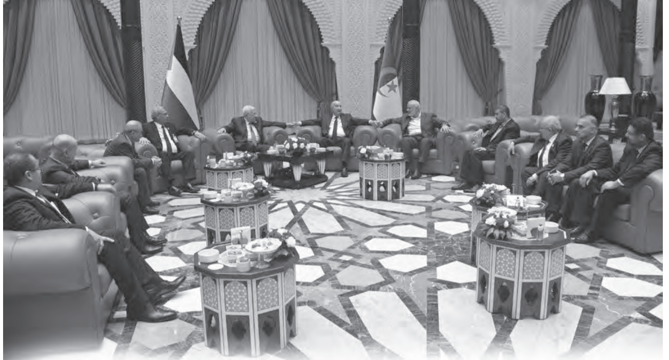
الجزائر تتبنى مصالحة تاريخية بين "السلطة الفلسطينية" و"حماس"