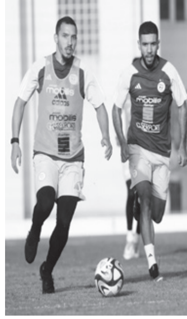
غيتون، المتخلفين عن انطلاق التربص بسبب التزاماتهم تجاه أنديةهم، يكونون قد وصلوا إلى سيدي موسى بعد ذلك

ينطلق اليوم رسميا التربص المغلق الخاص بالمنتخب الوطني بالمركز التقني بسيدي موسى تحسبا لمواجهة غينيا وأوغندا في تصفيات مونديال 2026، وهذا بعد التحاق جميع العناصر التي تم استدعاؤها من طرف الطاقم الفني الوطني.