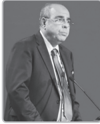
"الفاف" التي عرفت في عهدة واحدة والتي بدأت سنة 2021، مرور رئيسين الأول شرف

كشفت مصادر مقربة من محمد روراوة أن أنه قرر تقديم ملف ترشحه للعودة لرئاسة الاتحادية الجزائرية لكرة القدم، وإكمال العهدة الأولمبية المتبقية التي تنتهي منتصف سنة 2025، وتحضير الأرضية لرئيس جديد ليساعده في إعادة ترتيب البيت.