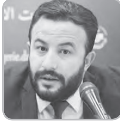
المحسوبية والممارسات المضرة للاقتصاد الوطني خاصة وان الدولة كانت تضح أموالا

وأوضح حمزة بوغادي في تصريحات للإذاعة الوطنية أنه "أصبح من الضروري إعادة النظر في الأدوات التي تسيير الاقتصاد الوطني وفقا لتعليمات رئيس الجمهورية، السيد عبد المجيد تبون الذي أكد أن الدولة الجزائرية ماضية في طريق عصرية الجانب الاقتصادي الذي أصبح حتمية للتكيف مع مختلف المعايير الدولية". كما أضاف أن "آليات مكافحة الفساد وإعادة هيكلة المؤسسات الاقتصادية مع منح الفرصة للكفاءات الوطنية سيجعل من الاقتصاد الوطني أكثر عصرية". وفي سياق متصل قال ذات الخبير أنه "أصبح من الضروري الاعتماد على التكنولوجيات الحديثة وعلى وسائل رقمنة الحياة الاقتصادية والاجتماعية التي من شأنها أن تعطي الشفافية لكل التعاملات بعيدا عن