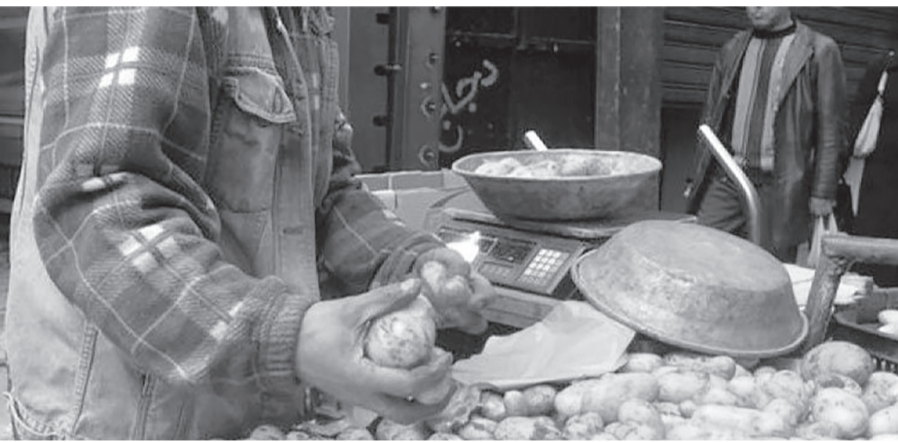
دعوة لخلق سوق محلية للبذور