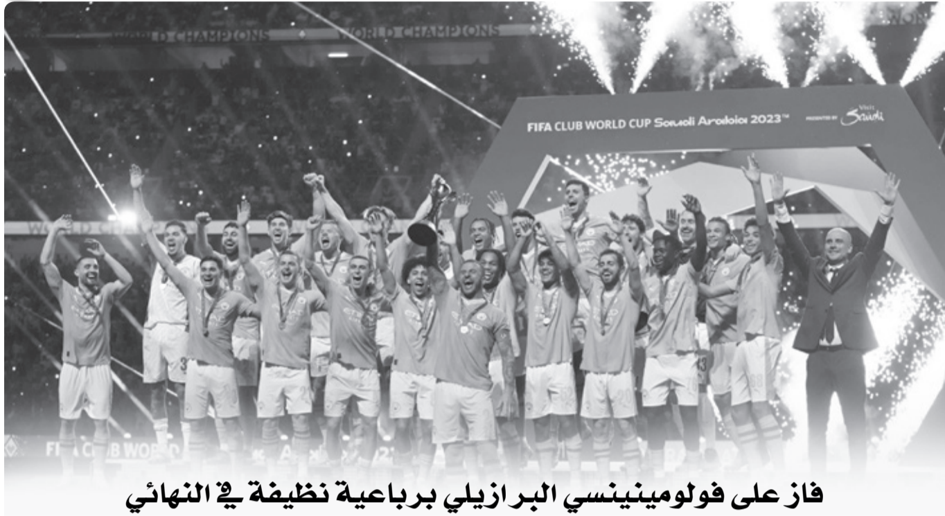
فاز على فولومينينسي البرازيلي برعاية نظيفة في النهائي