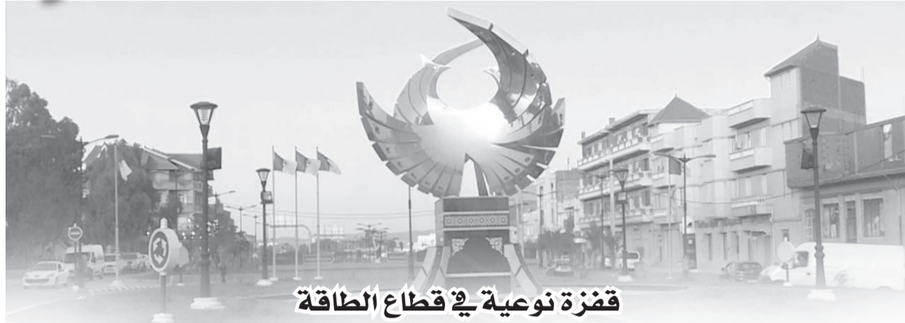
قفزة نوعية في قطاع الطاقة