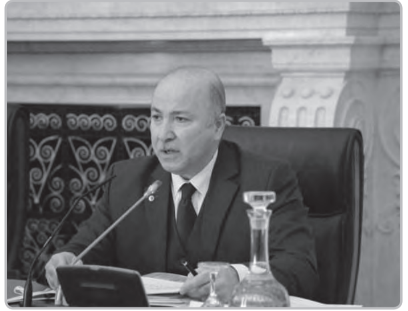
الجزائر تؤكد دعمها لتعزيز الصناعة والتصنيع في إفريقيا

وأعتمد الوزير الأول، الفرصة، للإشادة بالإنجاز الذي تم تحقيقه، مؤخرا، من خلال إنشاء "منطقة التبادل الحر القارية الإفريقية"، معتبرا أنها "ستشكل الإطار التنظيمي الأمثل لضمان تدفق البضائع والسلع بين بلدان، لما توفره من مزايا كبيرة للمنتجات ذات المنشأ الإفريقي، لاسيما الصناعية منها، ما يجعلها محركا حقيقيا لأهداف تطوير الصناعة في قارنتنا".