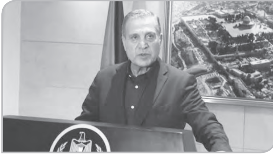
وأضاف أبو ردينة، إن قيام مستوطنين متطرفين باحاته وتكرار اقتحام شرطة الاحتلال لمصلى باب الرحمة وتخريب تمديدات الكهرباء داخله، يؤكد أن

ودعا أبو ردينة، الإدارة الأميركية إلى التدخل الفوري لوقف هذه الممارسات الخطرة، والضغط على إسرائيل لوقف كافة إجراءاتها أحادية الجانب.