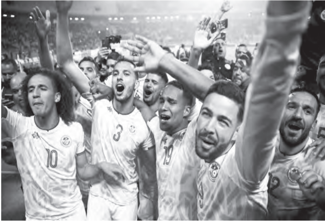
إيجابية في مباراة الذهاب وعادوا بتعادل إيجابي 1-1، ونجحوا في حسم التأهل في مباراة الإياب وسجل أهداف المغرب طارق بالدار البيضاء. تيسودالي، هدهين في الدقيقة

وكانت السنغال قد خطفت بطاقة التأهل من مصر بركلات الترجيح بعد تعادل الفريقان بهدف لمثله في مجموع مباراتي الذهاب في القاهرة ودمكار، وهما «أسود التيرانغا» بركلات الترجيح بنتيجة 3-1.