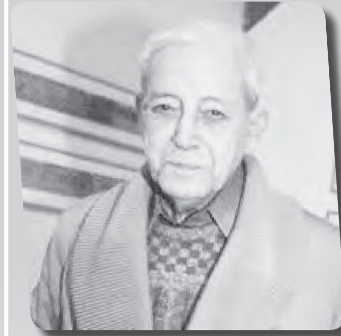
والرسم وكذا التعريف بالإبداع الروائي والقصصي الجزائري وخصوصا من خلال جائزة محمد ديب.

وكان افتتاح هذا الفضاء قد عرف عرض شريط وثائقي، الأول حول الفضاء نفسه والثاني، حول تجربة المسرحي الشاب حسين مختار في مجال مسرح الطفل، وهذا بحضور جوه ثقافية وفنية وعدد من الأطفال وأولياهم.