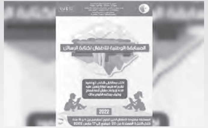
انطلقت نهاية الأسبوع، بالجزائر العاصمة الطبعة الثالثة للمسابقة الوطنية حول حقوق الطفل تحت شعار: «كن مبدعا»، وذلك بمناسبة اليوم العالمي للطفولة المصادف للفايح يونيو من كل سنة. وتم الإعلان عن إطلاق هذه المسابقة، خلال لقاء حول المصلحة الفضلى للطفل، نظم تحت إشراف وزيرة

وبدوره، أشاد المنسق المقيم للأمم المتحدة بالجزائر، أليخاندرو الفاريز، بمجهودات الجزائر في مجال الطفولة، منوها بالقانون المتعلق بحماية الطفل الصادر في 15 يوليو 2015.