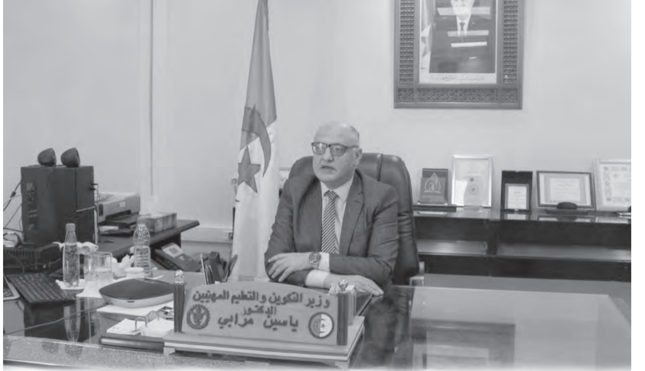
وزير التكوين والتعليم المهنيين يؤكد