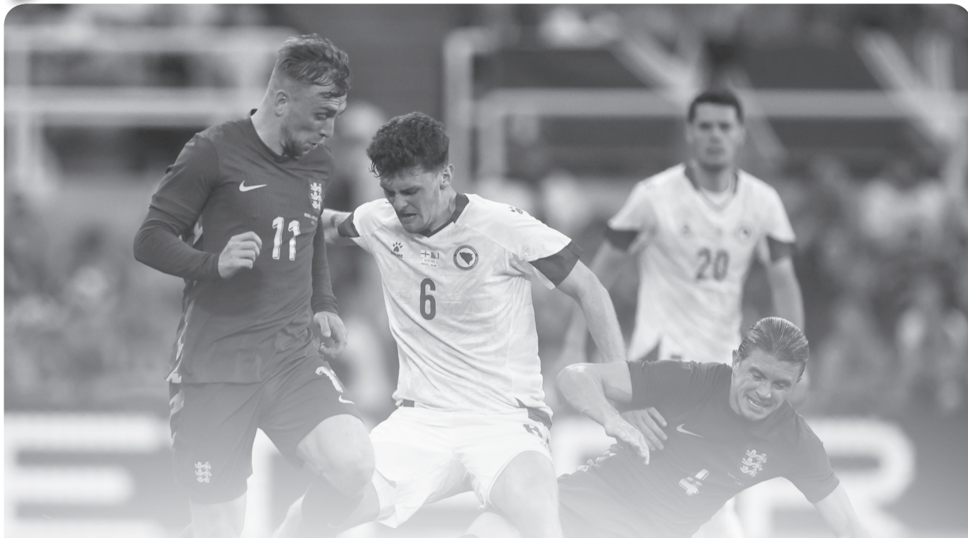
في مباراة ودية تحضيراً ليورو 2024