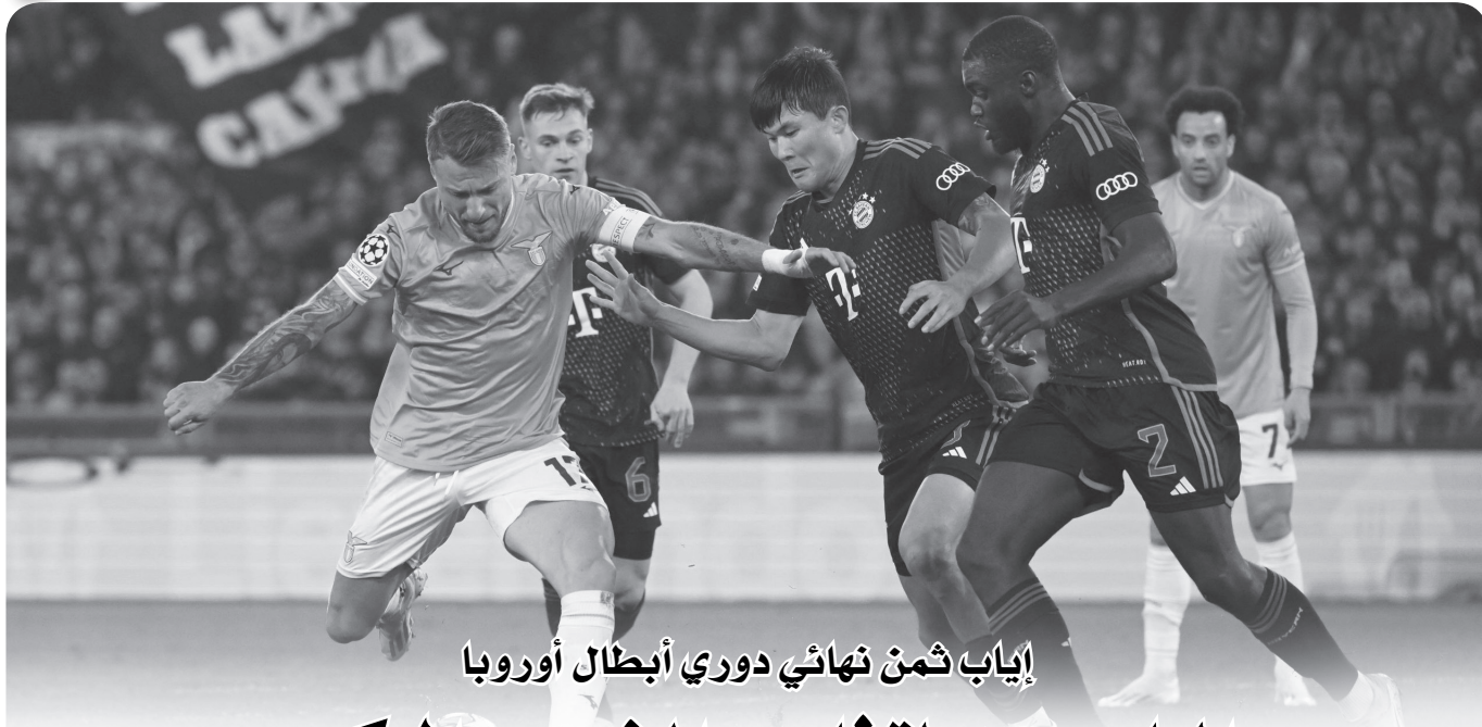
إياب ثمن نهائي دوري أبطال أوروبا