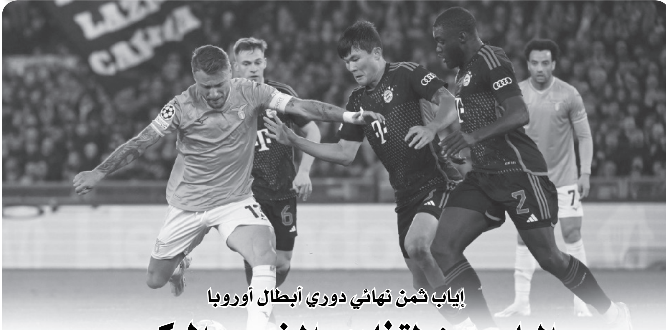
إياب ثمن نهائي دوري أبطال أوروبا