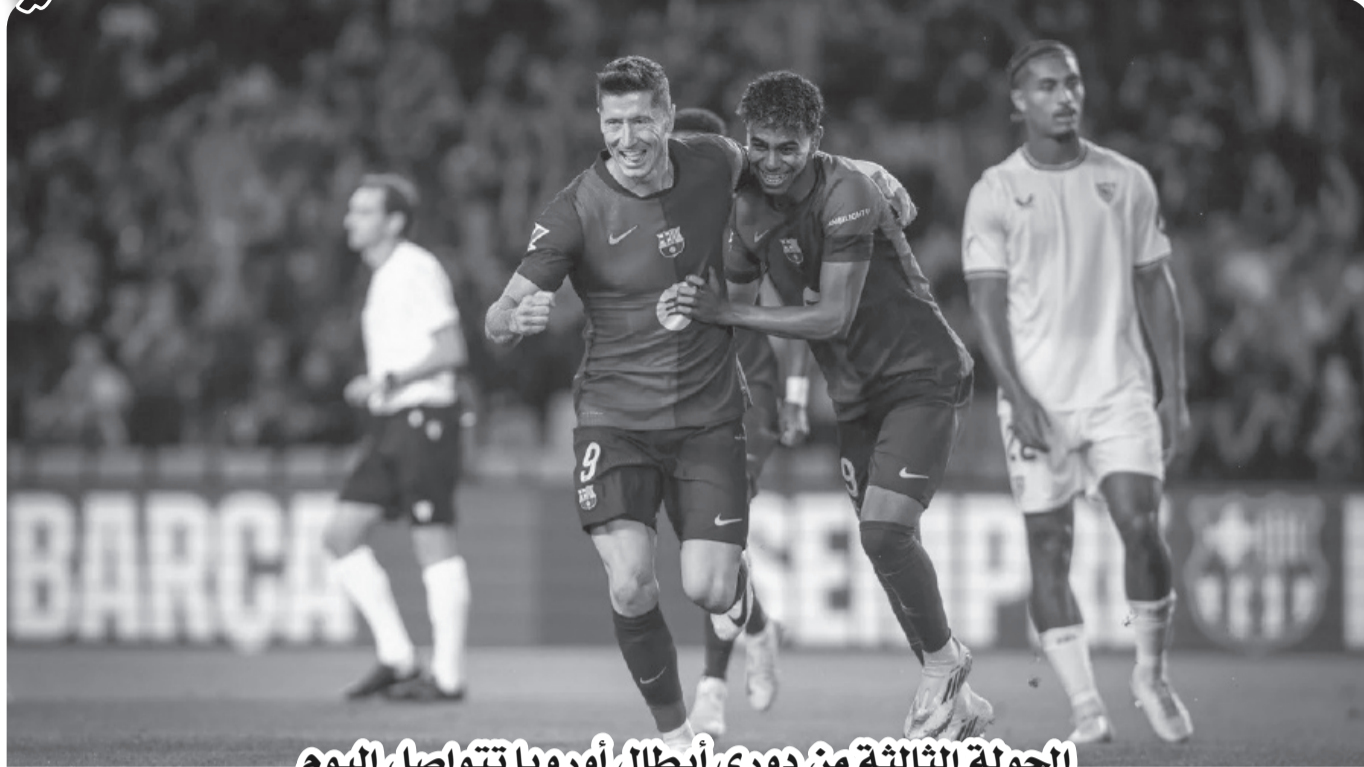
الجدولة الثالثة من دوري أبطال أوروبا تتواصل اليوم