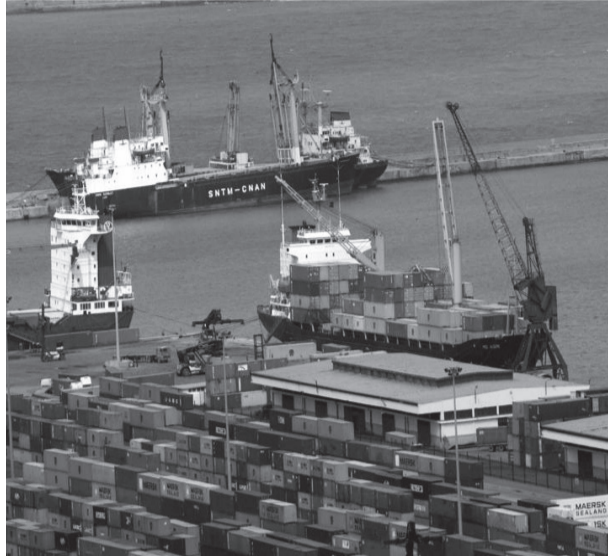
كانت موجهة للمضاربة

تضمن العدد رقم 50 من الجريدة الرسمية مرسوما رئاسي يتضمن انضمام الجزائر إلى الإتفاقية الدولية لسلامة الحاويات.