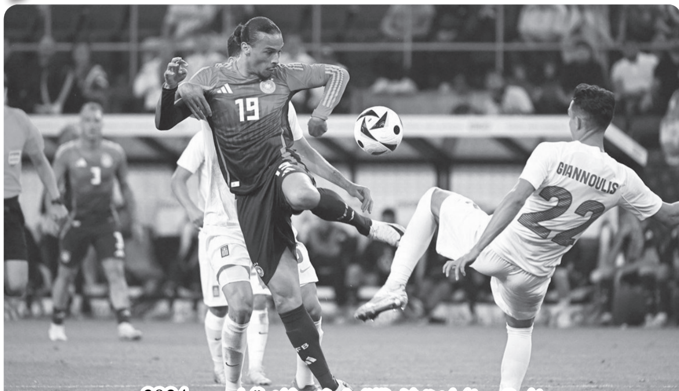
المستوى الباهت لا يقلق غوندوغان قبل يورو 2024